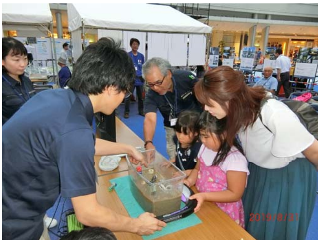
液状化実験モデルを体験する家族連れ