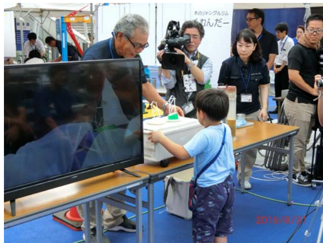
地盤と家屋モデルを体験する幼児