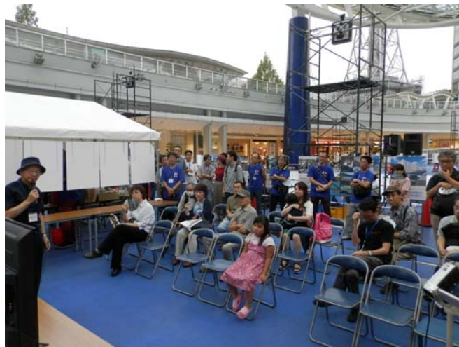
土の不思議を学ぼう！の解説時間