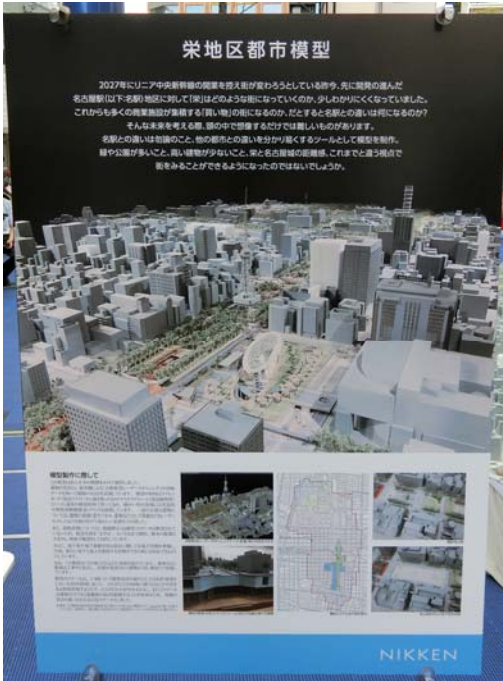
日建設計による栄の都市模型