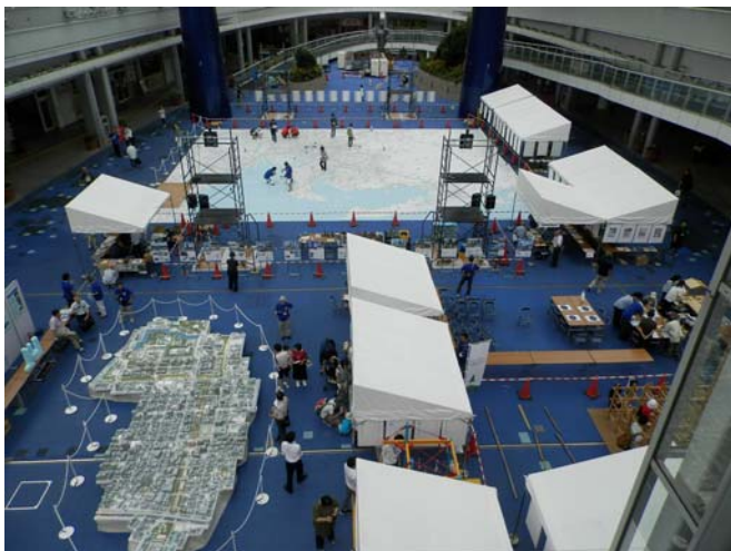
当日のイベント会場全景