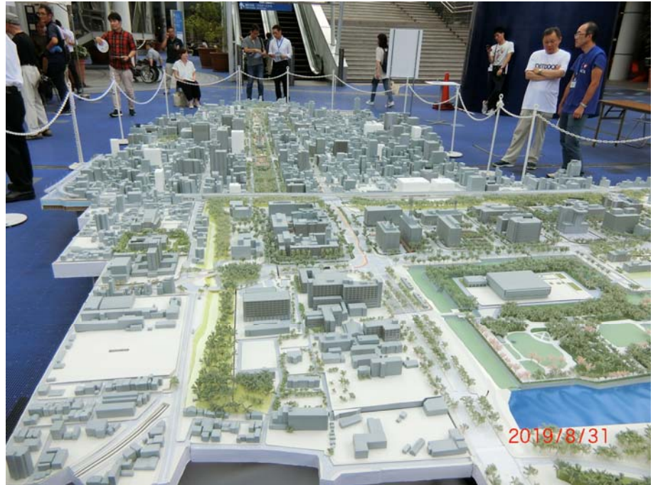
栄の都市模型 (S=1/400 モデル)