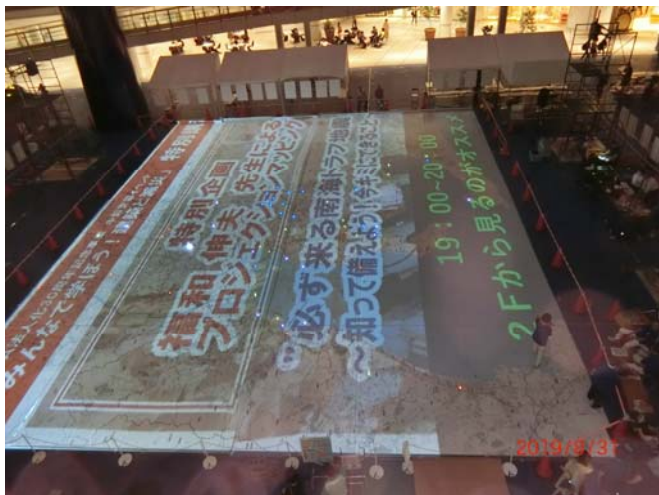
福和先生のプロジェクションマッピング